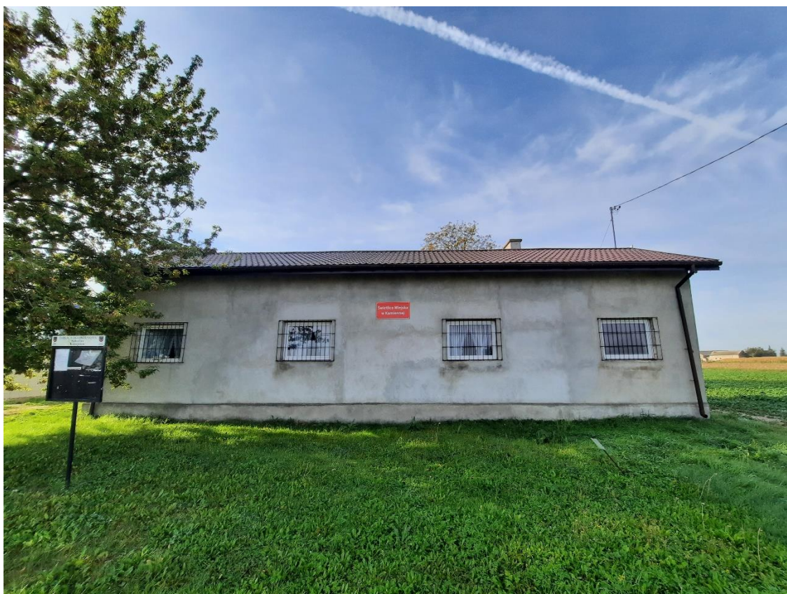
Zdjęcie 2. Elewacja północna