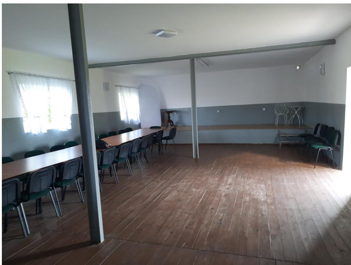
Zdjęcie 5. Widok sali