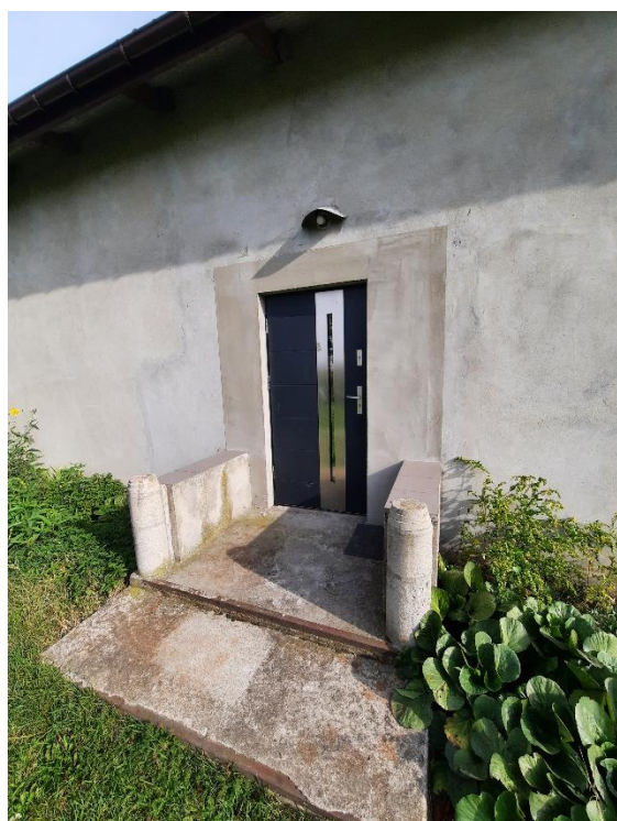
Zdjęcie . Wejście do strony południowej