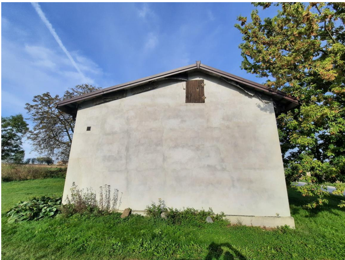
Zdjęcie 1. Elewacja wschodnia