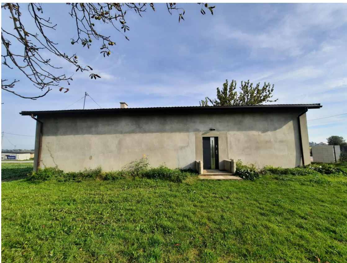
Zdjęcie 5. Elewacja południowa