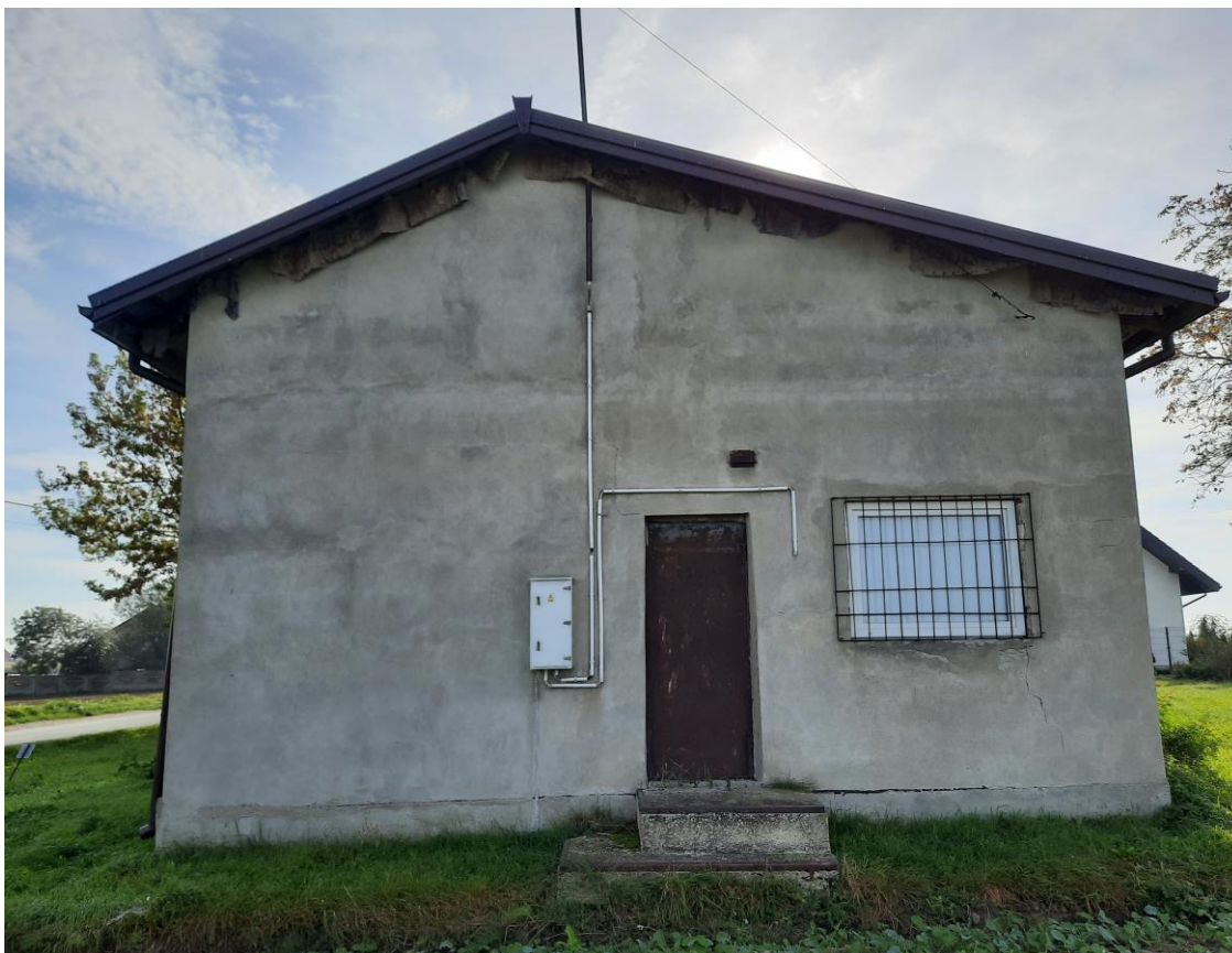
Zdjęcie 3. Elewacja zachodnia